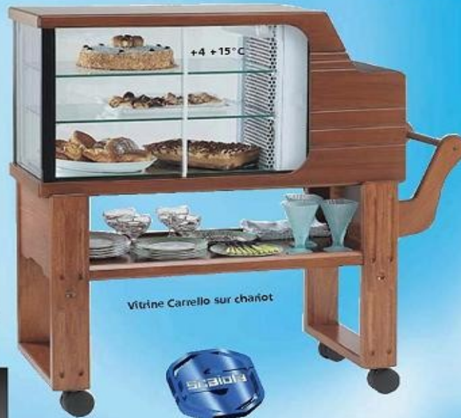
Vitrine Carrello sur chariot